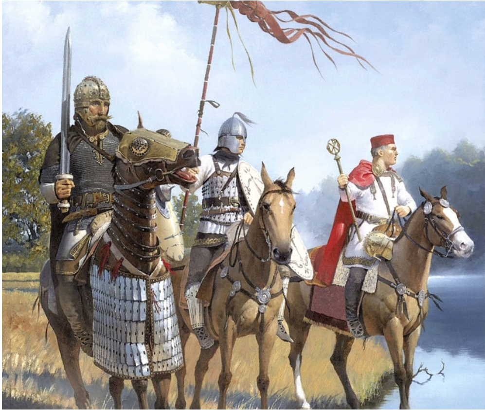
Рис. 2. Magister militum (головнокомандувач армією в регіоні) римської армії у супроводі буцелларіїв на Дунайському лімесі, V-VI ст. Ілюстрація Х. Д. Кабрери Пени.