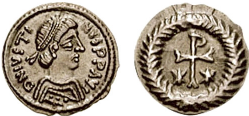
Рис. 3. Візантійський імператор Юстин II (565-578), зображений на монеті ціною в половину силікви. Монетний двір Равенни, 565-578 рр. Легенда на аверсі: «D[omi]N[us] IVSTINVS P[ater] P[atriae] AVG[ustus] [лат. «Володар Юстин, Батько Батьківщини, Великий»]». Переклад легенди наш