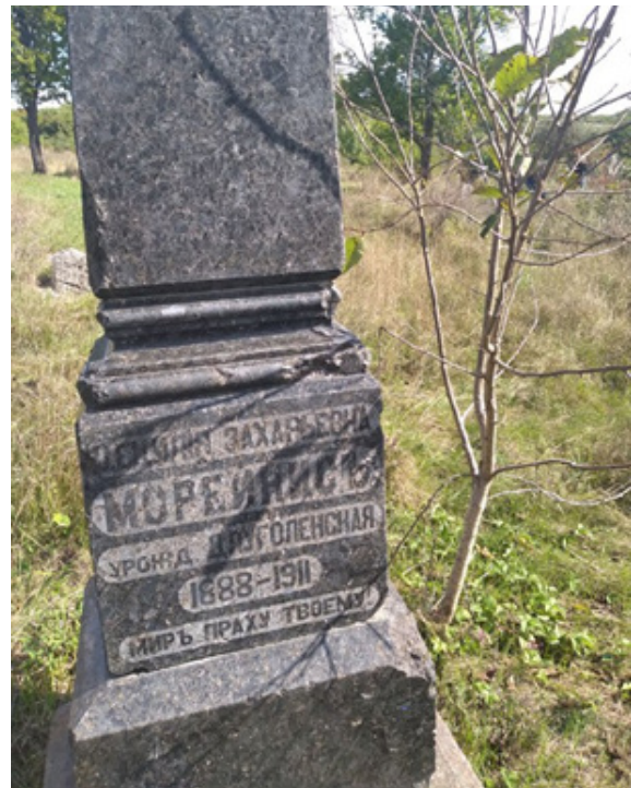
Фото 17. Мацева у вигляді стели м. Балта