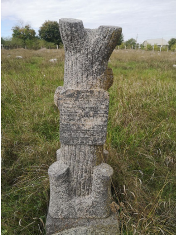
Фото 3. Мацева м. Балта