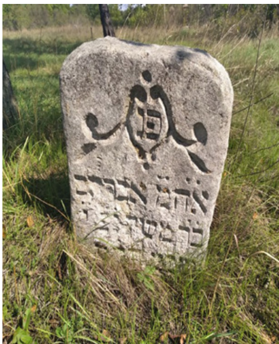
Фото 12. Мацева м. Балта