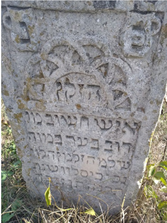
Фото 14. Мацева м. Балта