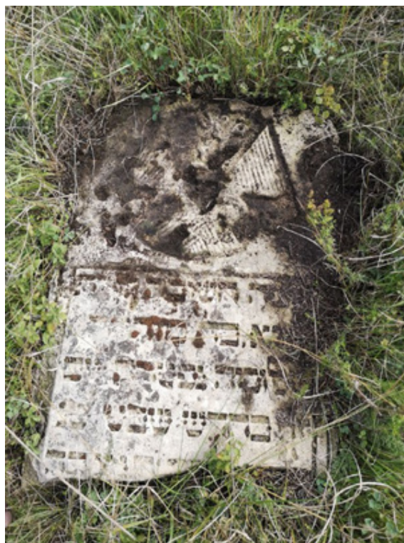
Фото 8. Фрагмент мацеви м. Балта