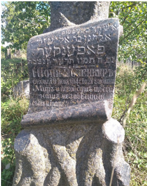
Фото 16. Мацева м. Балта