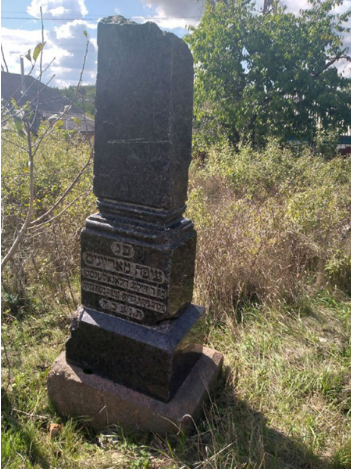
Фото 17а. Мацева у вигляді стели м. Балта