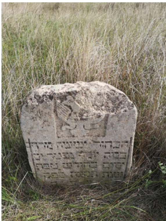
Фото 7. Мацева м. Балта