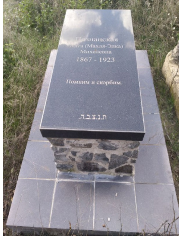
Фото 15. Мацева м. Балта