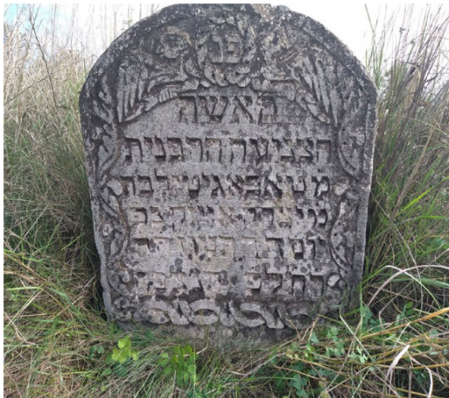
Фото 9. Мацева м. Балта