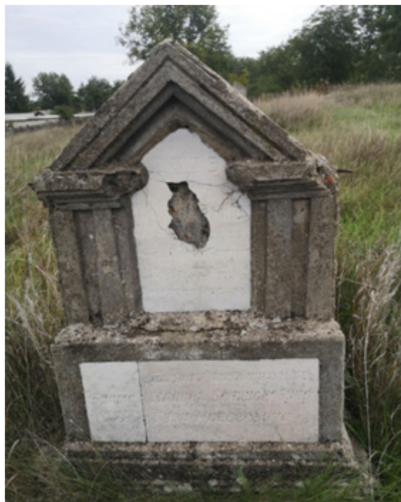
Фото 2. Огелі м. Балта