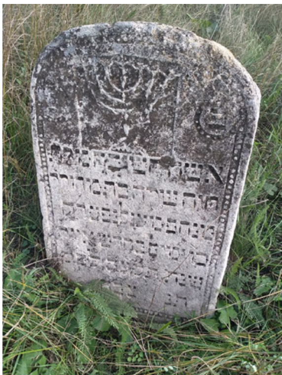
Фото 10. Мацева м. Балта