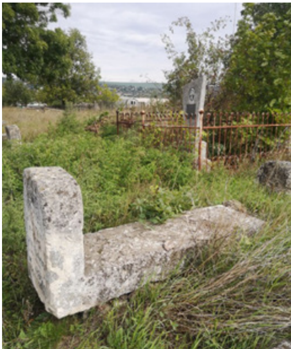
Фото 5. Мацева м. Балта