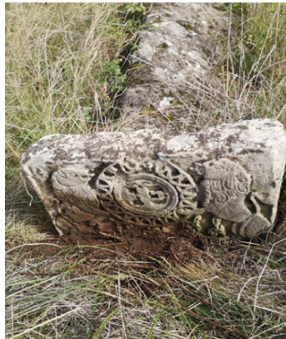
Фото 6. Мацева м. Балта