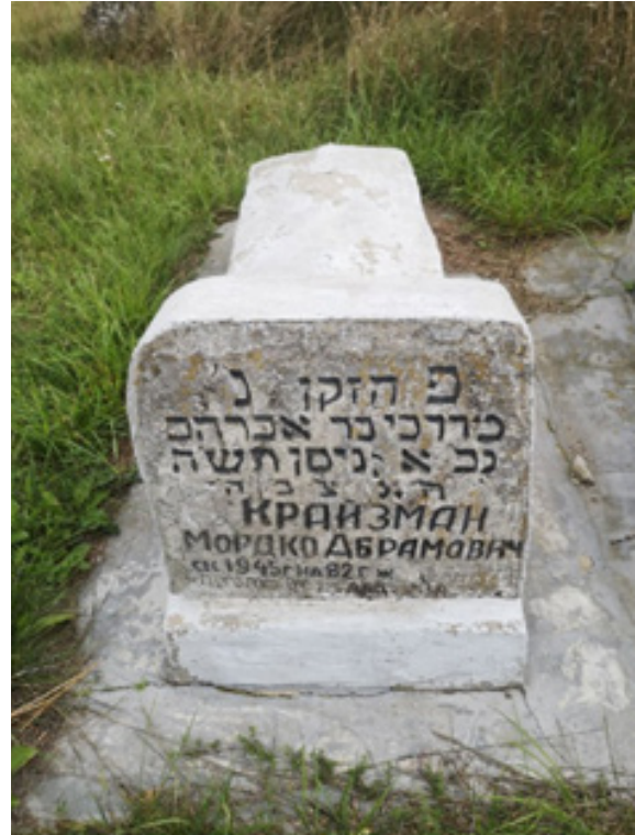
Фото 4. Мацева м. Балта