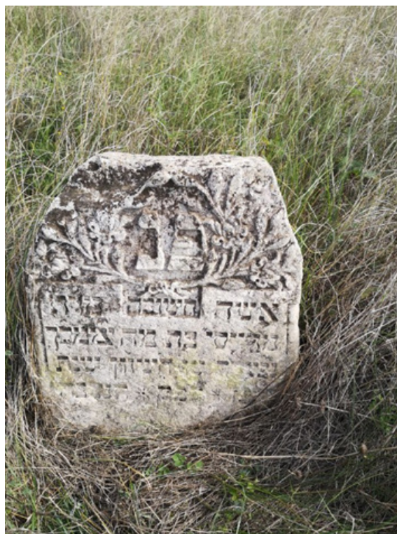
Фото 11. Мацева м. Балта