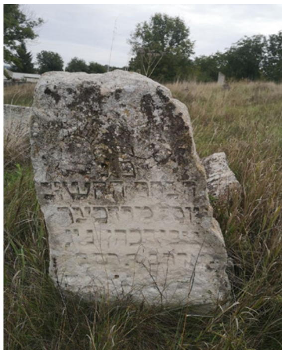
Фото 13. Мацева м. Балта