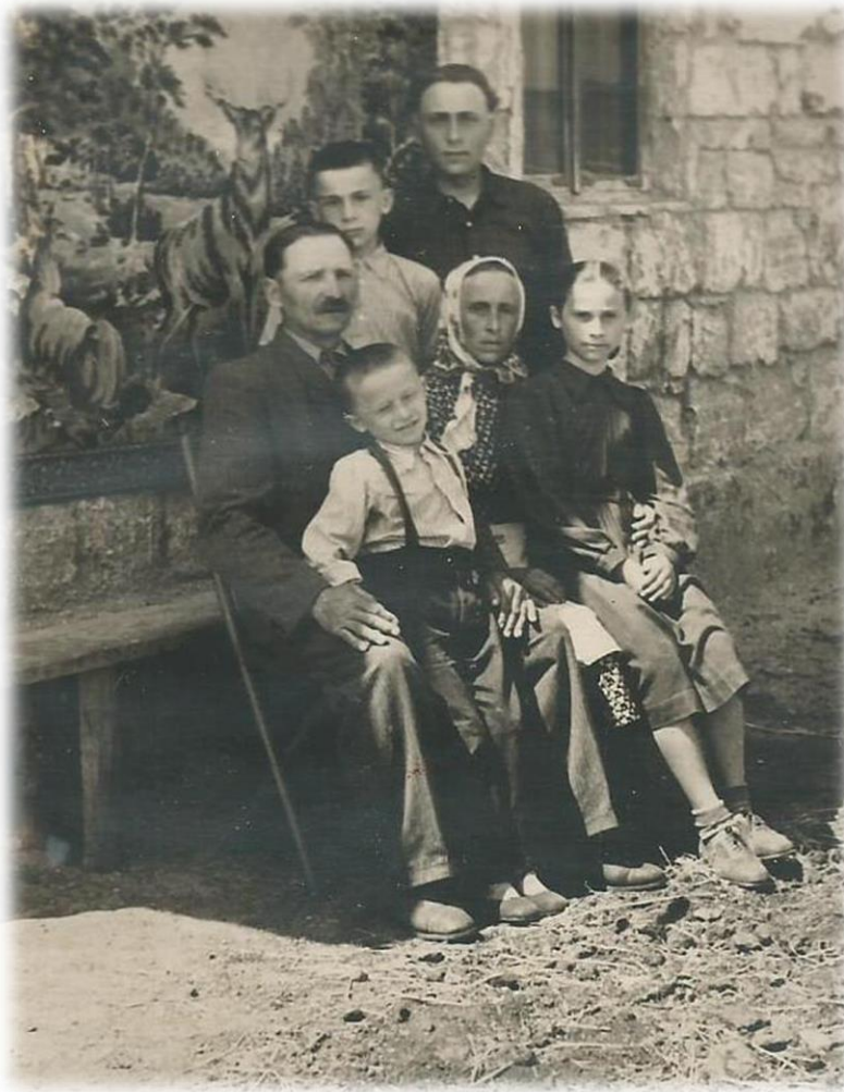
Фото 5. Сім'я депортованих, 1950-ті роки. Роздільнянщина

Висновки. Адаптація депортованих бойків в загальних рисах пройшла три етапи. Перший етап – «чужі»: це період одразу після депортації. Люди приїхали здалека, на перший погляд для місцевих вони «чужі», «незрозумілі». Другий етап – «інші»: включає в себе перші десять років життя в степу. На даному етапі місцеве населення вже знайоме з бойками, але вони залишаються окремою частиною локального суспільства. І останній етап – «свої»: на цьому етапі переселенці, врешті-решт, змогли вкорінитися в тутешній соціум, як повноправна частина громади. Поширюється практика шлюбів з місцевими, депортовані ходять до місцевої православної церкви, зазначимо, що повсякденне життя бойків одразу після переселення і тепер різняться. Головним щоденним завданням в перші роки після депортації було питання виживання, що стало можливим завдяки наполегливій та важкій праці. Працювали кожен день понад силу, від рання до зорі, аби мати змогу