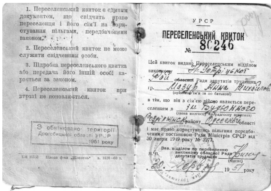
Фото 3. Переселенський квиток.

Депортовані отримували документи про переселення – переселенський квиток, в якому наводилася інформація про склад сім'ї, місце поселення родин, серед тих, хто вирушав у важкий, далекий та невідомий путь були новонароджені діти або літні члени родини (фото 3, фото 4)